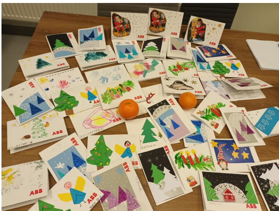
Joonis 7. Õpilaste valmistatud jõulukaardid ABBle