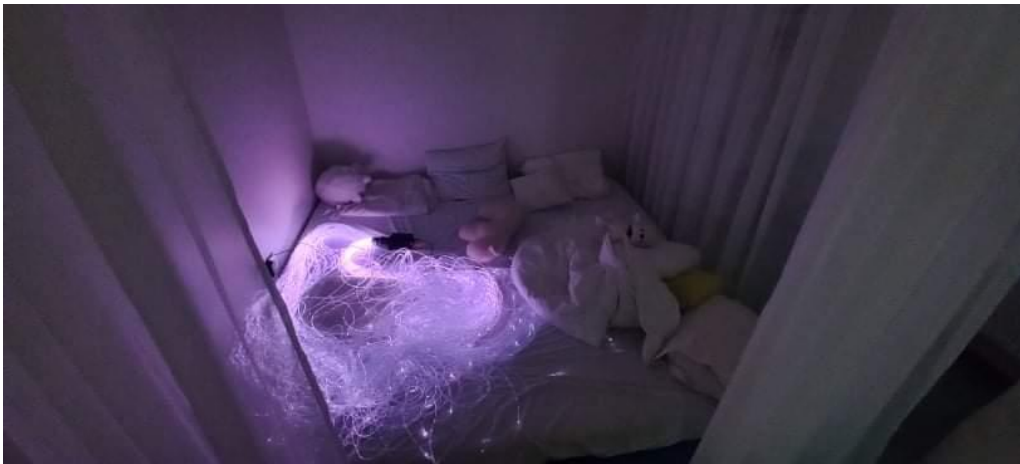
Joonis 2. Rahunemisruum