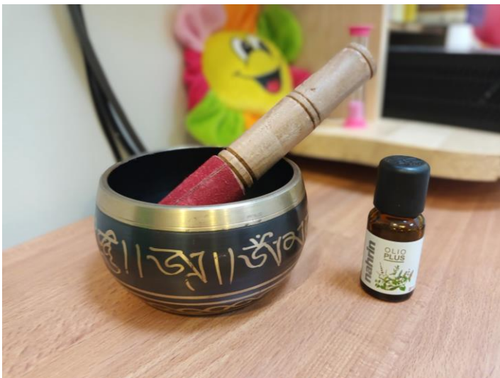
Joonis 11. Meditatsioonikauss ja aroomiteraapia lambis kasutatav eeterlik õli