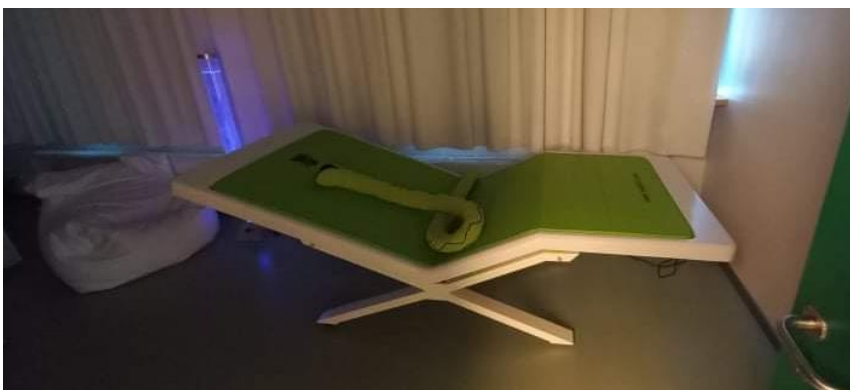
Joonis 4. Vibroakustiline voodi hingede toas