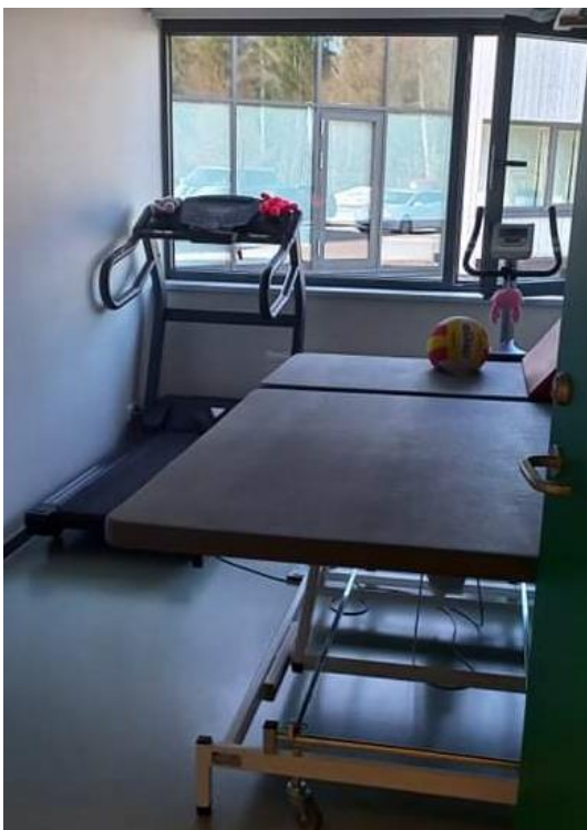
Joonis 3. Füsioteraapia ruum