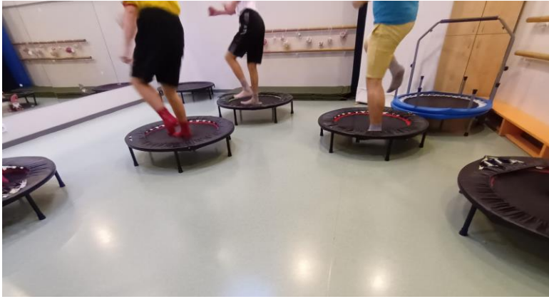
Joonis 13. Batuudid