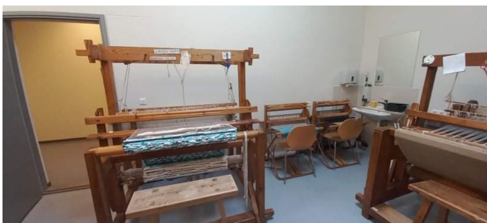
Joonis 6. Kangasteljed

Lapse huvide arengut toetatakse ka mitmete erinevate huvitegevuste kaudu. Peale koolipäeva lõppu on võimalik osaleda ringides: vaibakudumine (joonis 6), suusatamine, grossing, kepikõnd, ujumine, ronimine, jooga, tants, muusika, puutöö, ratsutamine (neist ainsana tasuline), taibude ring. Viimane on väga hinnatud, sest seal saavad lapsed õpetaja juhendamisel ehitada LEGOdest masinaid ja seadmeid ning tutvuda robotikaga. Tehnika- ja digipädevuse arendamist nii õpilaste kui ka õpetajate seas peab kool oluliseks. Tehakse koostööd tehnikafirma ABBga, kellelt saadakse tuge digivahendite soetamiseks (joonis 7).