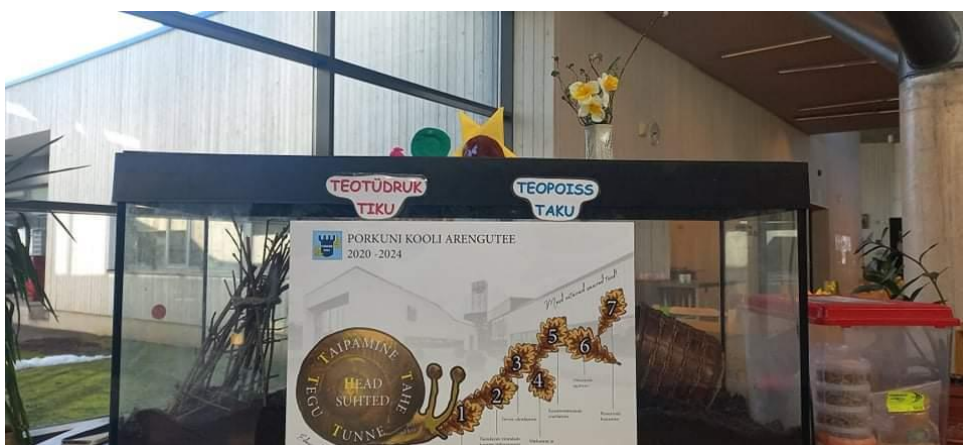
Joonis 1. Hiidtigude akvaarium

Porkuni Kool asub Porkuni külas Lääne-Virumaal. Kooli sõites on võimalik näha ka Porkuni mõisa, kooli endist asukohta. Praegune hoone, ehitatud 2011. aastal, on kaasaegne ja loodud arvestades õpilaste eripärasid. Majal on kuus tiiba ehk korpust, mis suubuvad kokku aatriumisse, kus on söökla, mängunurk, akvaarium kaladega ja hiidteod (joonis 1), kelle eest õpilased ise hoolitsevad ning suur vaba ala koolipere ühiste ürituste jaoks (hommikuringid, esinemised). Koolis on ka saal, kuid see on väiksem ja harvem kasutusel. Söökla peavad õpilased periooditi kohvikut.