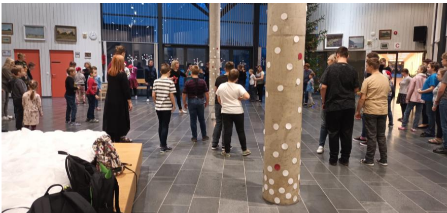
Joonis 8. Hommikuring

8.00 saabusime Porkuni Kooli. Fuajees toimus parasjagu hommikuring (joonis 8). Kohal oli kogu koolipere (välja arvatud HÕK, kellel on oma hommikuring, mis toimub 1 kord nädalas). Kõik, suured ja väikesed, laulsid koos laule, mis neile juba varem teada olid, tundus nagu igahommikune rituaal. Ringi keskel oli 1. adventi puhul küünel, mille üks õpilane sai ära kustutada. Kõik elasid talle kaasa, kaasõpilased jälgisid põnevusega ja õpetajad üritasid nõuandeid jagada. Seejärel läks lahti ringmäng. Taaskord teadsid kõik laulu sõnu ja liigutusi. Otsustasin ühineda ringiga ja mind võeti väga soojalt vastu, minu kõrval olevad poisid uurisid mu nime ja võtsid käest kinni. See oli julgustav algus päevale.