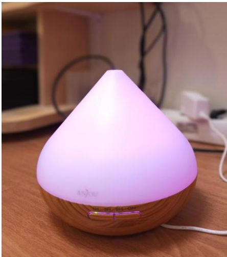
Joonis 10. Aroomiteraapia lamp