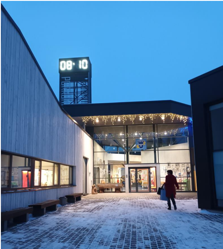
Joonis 5. Koolimaja

Koolihoone asub metsade vahel ning seda ümbritseb loodusrikas keskkond. Õuealal on võimalikud mitmed tegevused, seal on staadion, mänguala ja kasvuhoone koos kooliaia ja grillimajaga. Maja katusel on suur kell, mis näitab aega ümbruskonna elanikele (joonis 5).